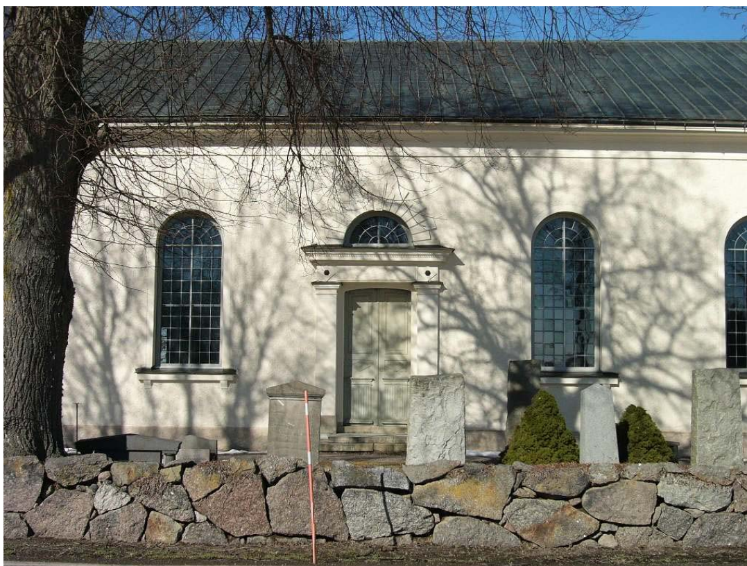
Kyrkans södra sida

Därefter har fasaderna renoverats och i kyrkorummet har de bakre bänkraderna tagits bort.